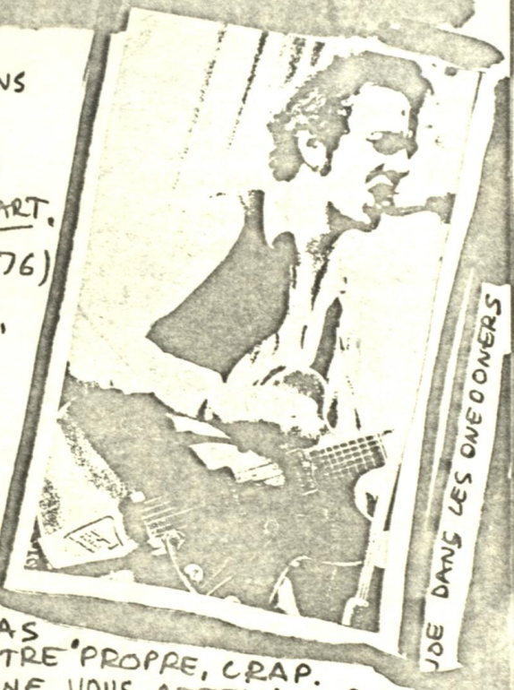
JOE DANS LES ONE OWNERS

3 EME GROUPE: THE CLASH AVEC '1977', 'WHITE RIOT', 'JANIE JONES', 'CAREER OPPORTUNITIES'