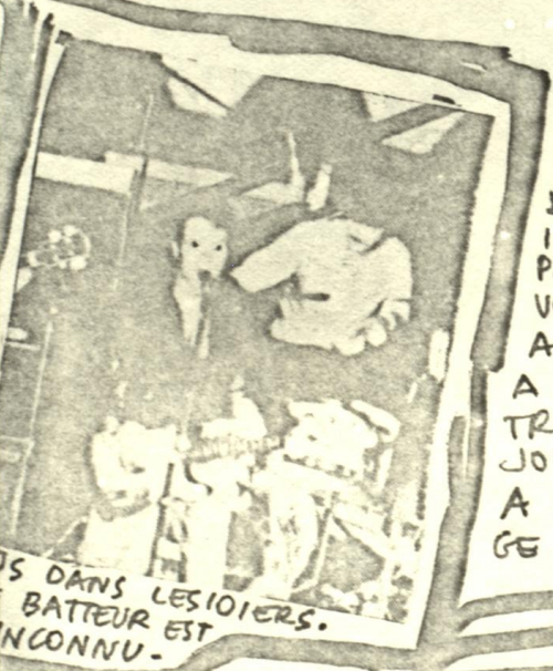
LES DANS LES 101ERS. BATTEUR EST INCONNU.

SI CETTE RETROSPECTIVE NE VOUS A PAS PARU ASSEZ DETAILLEE, ON S'EN FOUT. DE TOUTE FAÇON NOUS AUSSI, IL FALLAIT BIEN REMPLIR UNE PAGE. SI CA NE VOUS PLAIT PAS VOUS N'AVEZ QU'A FAIRE VOTRE PROPRE, CRAP. A PROPOS DE RETROSPECTIVE, NE VOUS ATTENDEZ PAS A EN AVOIR UNE A CHAQUE NUMERO, ÇA NOUS FAIT TROP CHIER DE CONSULTER DES VIEUX NUMEROS DE JOURNAUX ANGLAIS. A PROPOS DE CLASH ON ATTEND TOUJOURS LEUR PASSAGE EN BELGIQUE ET LEUR SINGLE. MARK LOGE