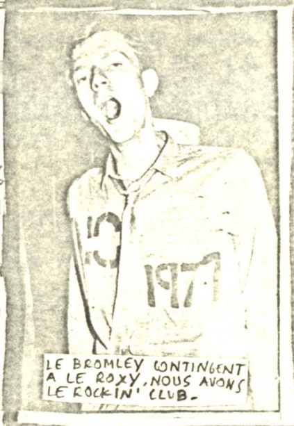
LE BROMLEY CONTINGENT A LE ROXY. NOUS AVONS LE ROCKIN' CLUB.

QUA NON DE LA SURVIE DE NOTRE MOUVEMENT. To You! POUR QUE CE SOIT PLUS FACILE POUR NOUS, ENVOYEZ-NOUS 80 FRS POUR 4 NUMEROS, FRAS D'ENVOI COMPRIS. SINON ZIPV' EST VENDU AU ROCKIN' CLUB ET DANS CERTAINS MAGASINS DE DISQUES. SO BUY IT OU BIEN SI VOUS VOULEZ RECEVOIR ZIPV', THE REAL '77 CRAP, NUMERO PAR NUMERO, ENVOYEZ 20 FR. EASY, NO? (P. SARFATEE)