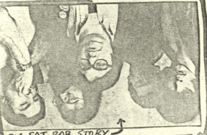
BIG FAT BOB STORY